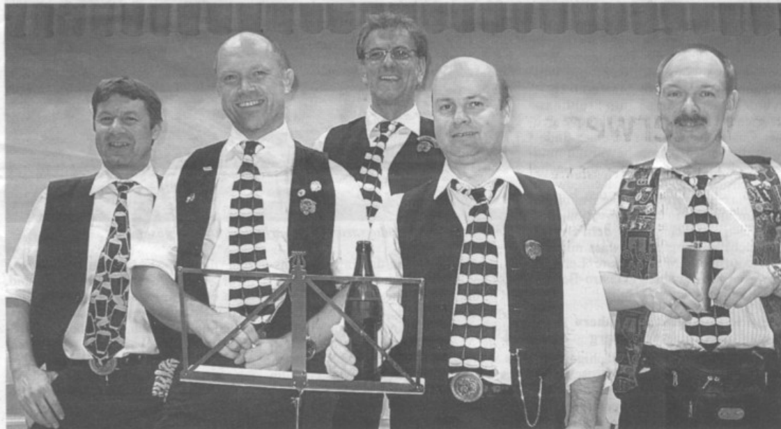
Die Black Tiger haben an der Nurrechlöpfer-GV ihren letzten Auftritt gegeben.

Die Guggen veranstalten am 3./4. August eine weitere Ausgabe der legendären Fishparade. An diesem Fest servieren die Guggen als Hauptmenü «Zanderfilet im Bierteig». Es wird auch für musikalische Unterhaltung gesorgt sein, selbstverständlich wird auch ein Auftritt der Rekinger Gugge auf dem Programm stehen. Im September starten dann wieder die offiziellen Guggenproben. Diese finden jeweils am Montagabend, um 20 Uhr, im Schützenhaus Rekingen statt. Dazu sind alle Interessierten, die in Zukunft in der Gugge mitwirken möchten, herzlich eingeladen. Auf der Website www.nurrechloepfer.ch sind neben tollen Bildern von der Fasnachtsaison 2006/2007 entsprechende Infos zu den Proben publiziert.